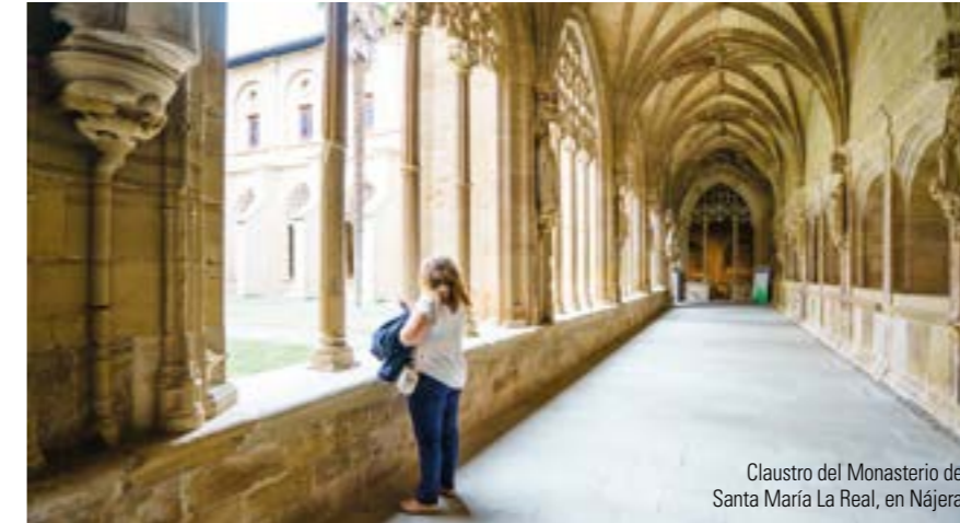
Claustro del Monasterio de Santa María La Real, en Nájera

Pocos valles atesoran tanta riqueza patrimonial como el del río Cárdenas. Lo abordamos desde la cabecera de la comarca, Nájera, donde se asienta el monasterio de Santa María la Real, que fue impulsado por el rey D. García Sánchez III, finalizó en 1052 y refleja los estilos barroco, última época del gótico y comienzo del renacimiento. En su panteón real se encuentran doce tumbas de dos dinastías (los Abarca y García Ramírez) y, en su claustro de los Caballeros, están sepultados numerosos nobles.