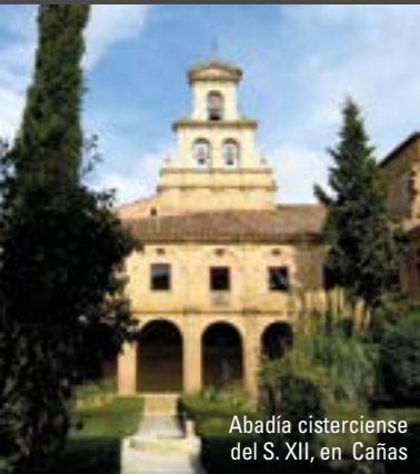
Abadía cisterciense del S. XII, en Cañas

*San Asensio - Casalarreina 21 km. 18 minutos