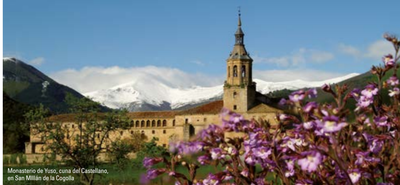
Monasterio de Yuso, cuna del Castellano, en San Millán de la Cogolla