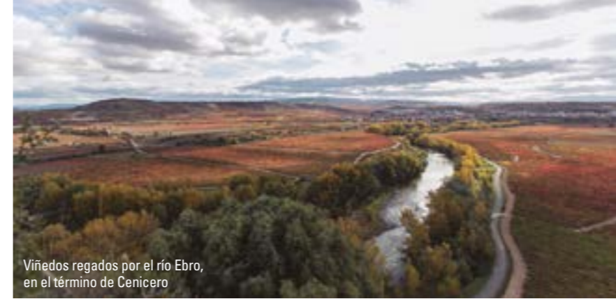
Viñedos regados por el río Ebro, en el término de Cenicer

Cenicero es una de las localidades con mayor tradición de vino, de hecho, buena parte de su economía se basa en la agricultura, la elaboración vinícola de sus grandes bodegas y en la industria auxiliar. Bodegas centenarias y calados tradicionales se distribuyen por el pueblo y conviven con yacimientos de las culturas celta, íbera y romana que son testimonio de su dilatada historia.