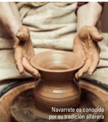
Navarrete es conocido por su tradición alfarera