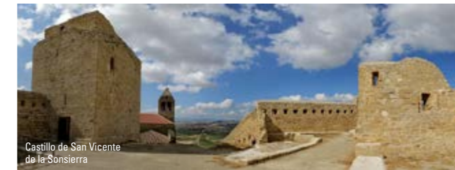
Castillo de San Vicente de la Sonsierra

Buena parte de los municipios de La Ruta del Vino Rioja Alta, albergan estos majestuosos edificios. En Ábalos, por ejemplo, destacan el palacio del Virrey de Ábalos y la casona del Marqués de Legarda. Briñas, también es sede de numerosas casonas bien conservadas con la bella singularidad de sentir el río Ebro en el interior de sus cimientos. Finalmente, el municipio de San Vicente de la Sonsierra atesora numerosas casonas de este tipo además de un extraordinario puente medieval, construido en el S. XIII y rehabilitado en el S. XVI.