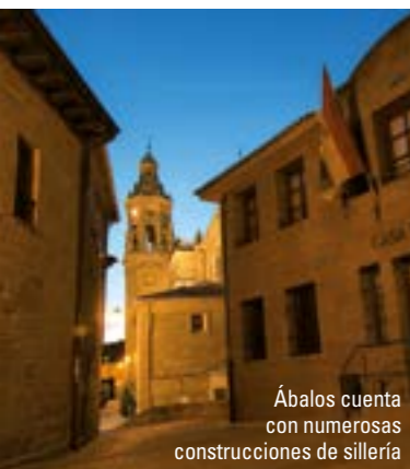
Ábalos cuenta con numerosas construcciones de sillería