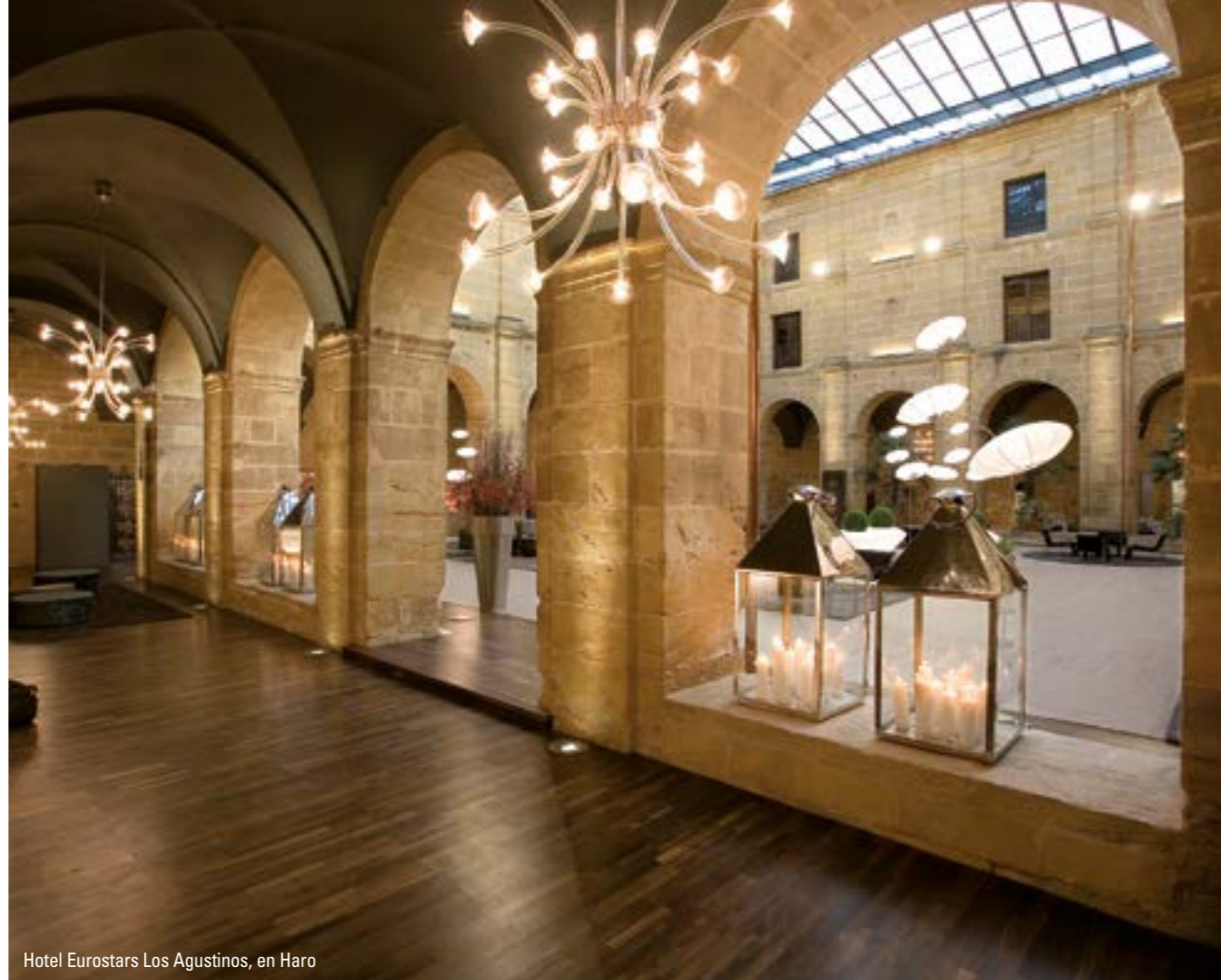
Hotel Eurostars Los Agustinos, en Haro

El territorio de La Rioja Alta cuenta con numerosas casas solariegas que serán las protagonistas de nuestro segundo paseo. Están construidas con piedras de sillería y son originarias de los siglos XVI, XVII y, en menor medida, del XVIII.