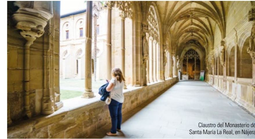
Claustro del Monasterio de Santa María La Real, en Nájera

Pocos valles atesoran tanta riqueza patrimonial como el del río Cárdenas. Lo abordamos desde la cabecera de la comarca, Nájera, donde se asienta el monasterio de Santa María la Real, que fue impulsado por el rey D. García Sánchez III, finalizó en 1052 y refleja los estilos barroco, última época del gótico y comienzo del renacimiento. En su panteón real se encuentran doce tumbas de dos dinastías (los Abarca y García Ramírez) y, en su claustro de los Caballeros, están sepultados numerosos nobles.