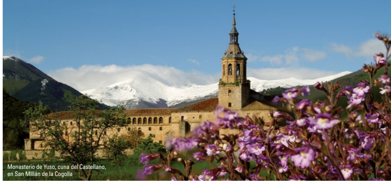
Monasterio de Yuso, cuna del Castellano, en San Millán de la Cogolla