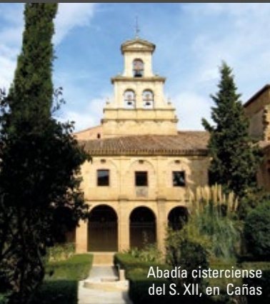
Abadía cisterciense del S. XII, en Cañas

*San Asensio - Casalarreina 21 km. 18 minutos