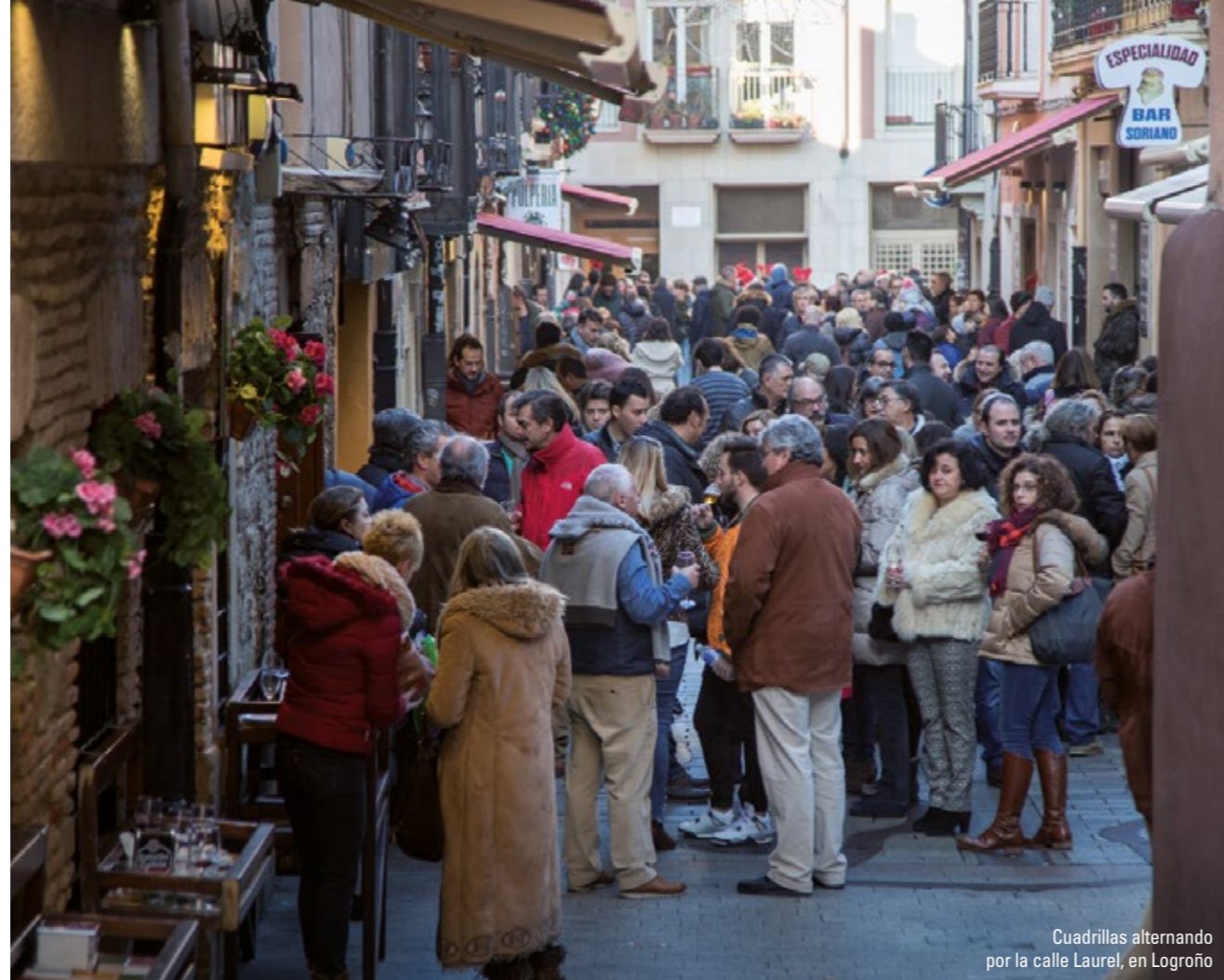
Cuadrillas alternando por la calle Laurel, en Logroño