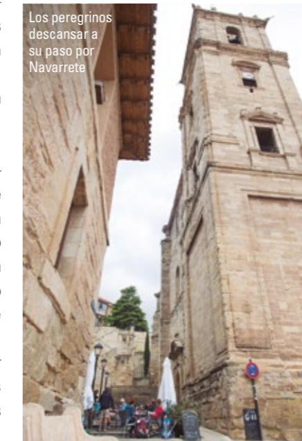
Los peregrinos descansar a su paso por Navarrete

Desde aquí nos desplazaremos hasta Nájera, denominada popularmente 'capital del mueble', por su vinculación empresarial y comercial a la fabricación y venta de muebles. La actividad de esta localidad y su comarca también está basada en la agricultura, especialmente en el viñedo. Patrimonialmente sobresale el monasterio de Santa María la Real, que fue mandado construir por el rey D. García Sánchez III en el siglo X y se convirtió en sede episcopal y panteón real.