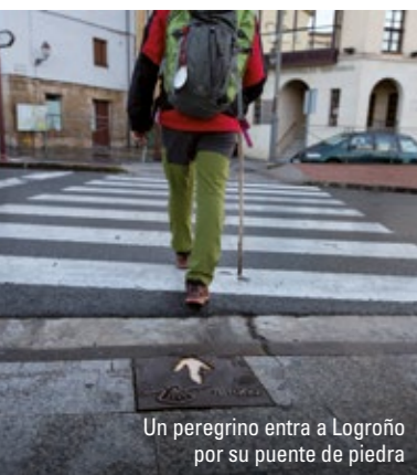
Un peregrino entra a Logroño por su puente de piedra