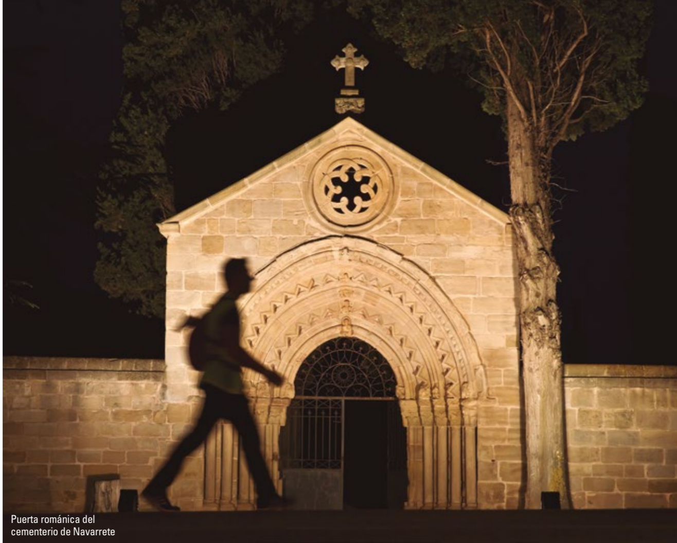
Puerta románica del cementerio de Navarrete