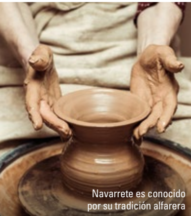
Navarrete es conocido por su tradición alfarera