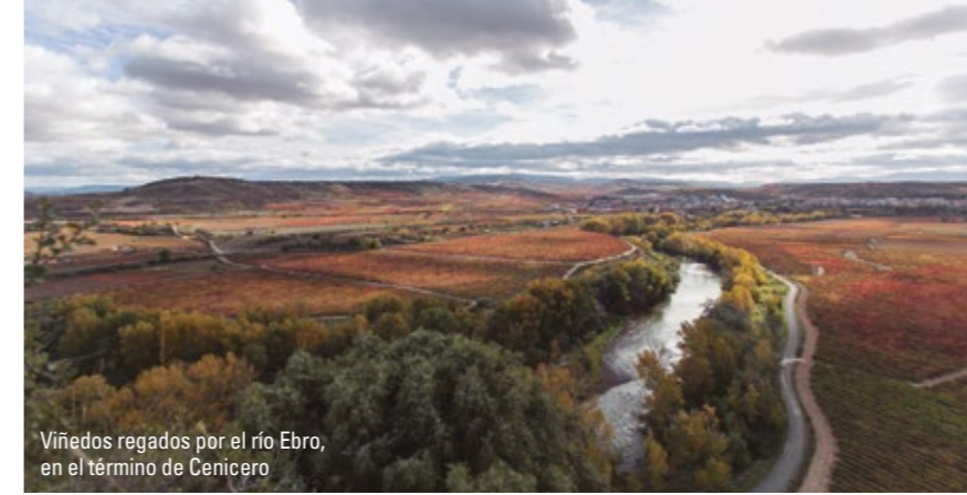
Viñedos regados por el río Ebro, en el término de Cenicerero

Cenicero es una de las localidades con mayor tradición de vino, de hecho, buena parte de su economía se basa en la agricultura, la elaboración vinícola de sus grandes bodegas y en la industria auxiliar. Bodegas centenarias y calados tradicionales se distribuyen por el pueblo y conviven con yacimientos de las culturas celta, íbera y romana que son testimonio de su dilatada historia.