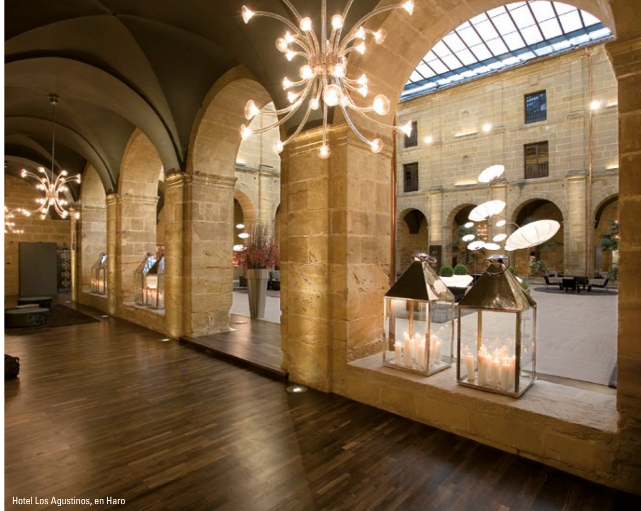
Hotel Los Agustinos, en Haro

El territorio de La Rioja Alta cuenta con numerosas casas solariegas que serán las protagonistas de nuestro segundo paseo. Están construidas con piedras de sillería y son originarias de los siglos XVI, XVII y, en menor medida, del XVIII.