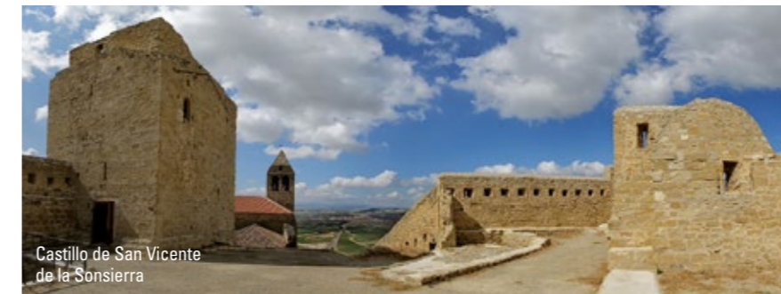
Castillo de San Vicente de la Sonsierra

Buena parte de los municipios de La Ruta del Vino Rioja Alta, albergan estos majestuosos edificios. En Ábalos, por ejemplo, destacan el palacio del Virrey de Ábalos y la casona del Marqués de Legarda. Briñas, también es sede de numerosas casonas bien conservadas con la bella singularidad de sentir el río Ebro en el interior de sus cimientos. Finalmente, el municipio de San Vicente de la Sonsierra atesora numerosas casonas de este tipo además de un extraordinario puente medieval, construido en el S. XIII y rehabilitado en el S. XVI.