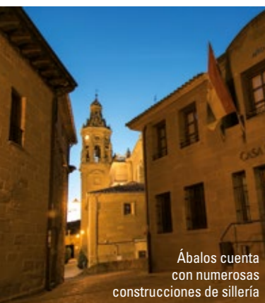
Ábalos cuenta con numerosas construcciones de sillería